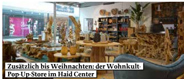
Zusätzlich bis Weihnachten: der Wohnkult-Pop-Up-Store im Haid Center