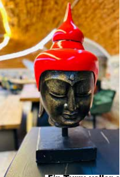
Ein Turm voller einzigartiger, exklusiver Wohn-Accessoires: